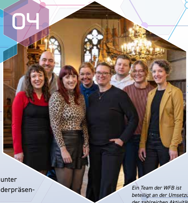
Ein Team der WFB ist beteiligt an der Umsetzung der zahlreichen Aktivitäten zum Tag der Deutschen Einheit 2026.

→ In diesem Jahr ist ganz Deutschland zu Gast im Land Bremen. Unter dem Motto „Viele Stärken – ein Land“ lädt die Freie Hansestadt vom 2. bis 4. Oktober Menschen aus allen Regionen oder aus dem gesamten Bundesgebiet gemeinsam zu feiern. Drei Tage lang wird dann die Innenstadt zu einer großen Bühne für Kunst, Kultur, Politik und Begegnung. Bremerinnen und Bremer, Bremerhavenerinnen und Bremerhavener sowie Besucherinnen und Besucher aus ganz Deutschland feiern gemeinsam mit Politik, Wirtschaft und Gesellschaft ein Fest der Demokratie und des Zusammenhalts – friedlich, offen und hanseatisch herzlich. Mit einem dreitägigen Bürgerfest in der Bremer City sowie zwischen Hauptbahnhof und Weser will sich Bremen vor großem Publikum zeigen. Geplant sind ein buntes Kultur- und Bühnenprogramm, Konzerte, Inszenierungen auf der Weser, eine Ländermeile mit Präsentationen aller Bundesländer und ein feierlicher Abschluss der diesjährigen Bremer Bundesratspräsidentschaft. Veranstalterin ist die Freie Hansestadt Bremen, vertreten durch die Senatskanzlei. Die WFB wird unter anderem Unterstützung beim Marketing und bei der Umsetzung der Länderpräsentation Bremen/Bremerhaven leisten.