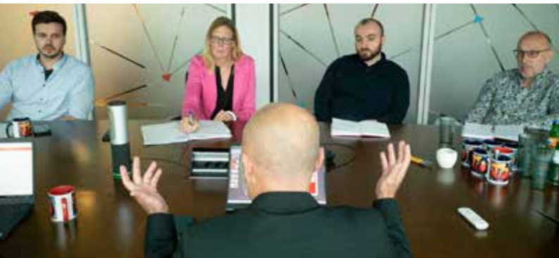
Vielfalt ist bei TO DO Solutions Teil des Unternehmenserfolgs.

https://www.bab-bremen.de/de/page/programm/diversity-kmu