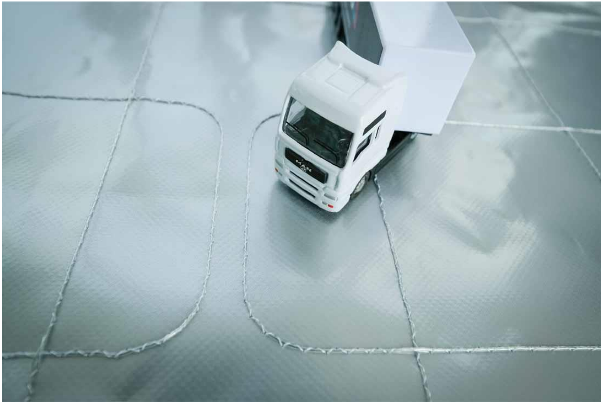
Die Alarmanlage kann auch nachträglich auf die Lkw-Planen angebracht werden.