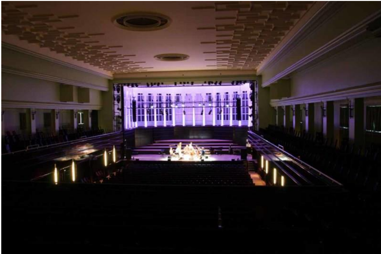
1.400 Besucher fasst der Große Saal des Bremer Konzerthauses.