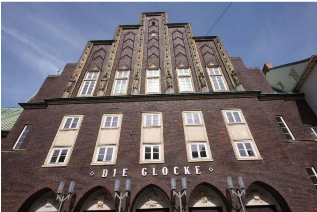
Bereits seit 1973 steht das Gebäude unter Denkmalschutz.

Musiker von Rang lieben sie. Für viele ist „ Die Glocke “ auf der Tournee gesetzt. Das Konzerthaus im Herzen Bremens punktet mit einer Weltklasse-Akustik. Es lässt eine ganz besondere Nähe zwischen Künstlern und Publikum zu und ist eine Augenweide im Stil des Art Déco. In diesem Jahr feiert das Haus seinen 90. Geburtstag.