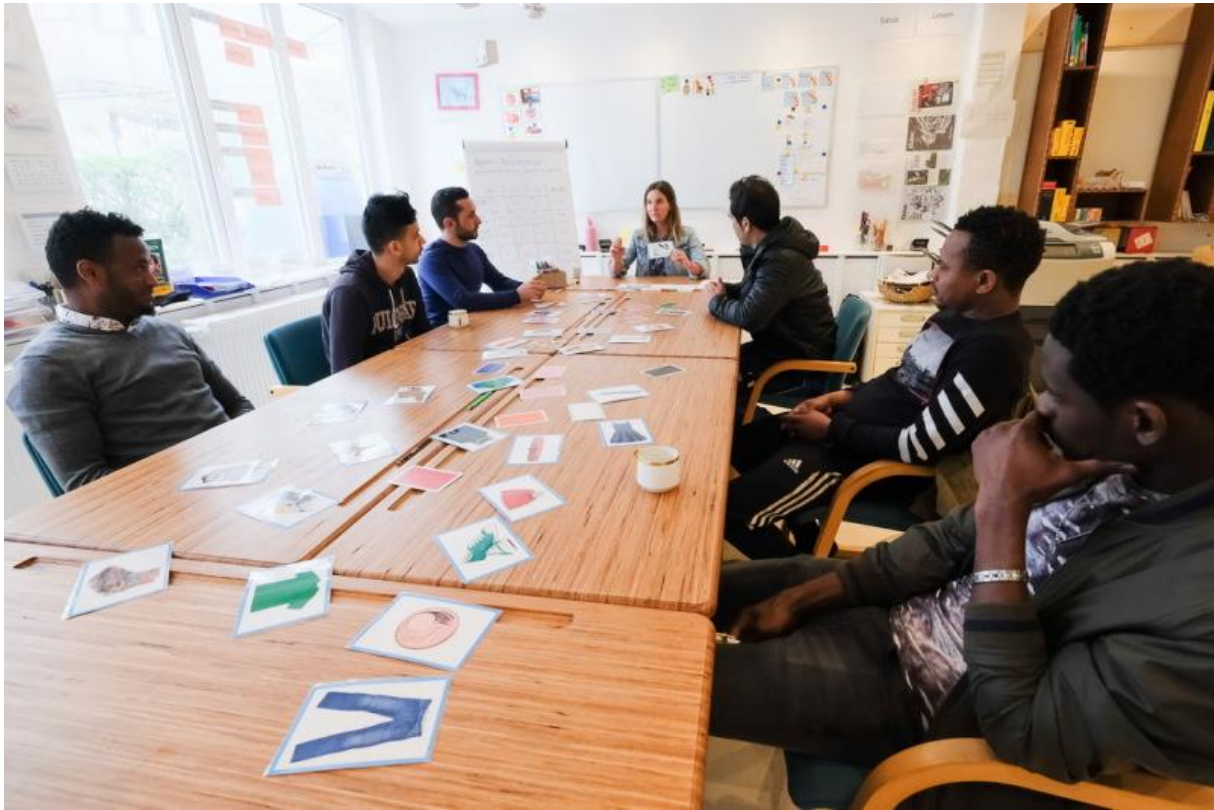
Auch Deutschunterricht steht bei dem Projekt Weserholz auf dem Stundenplan.