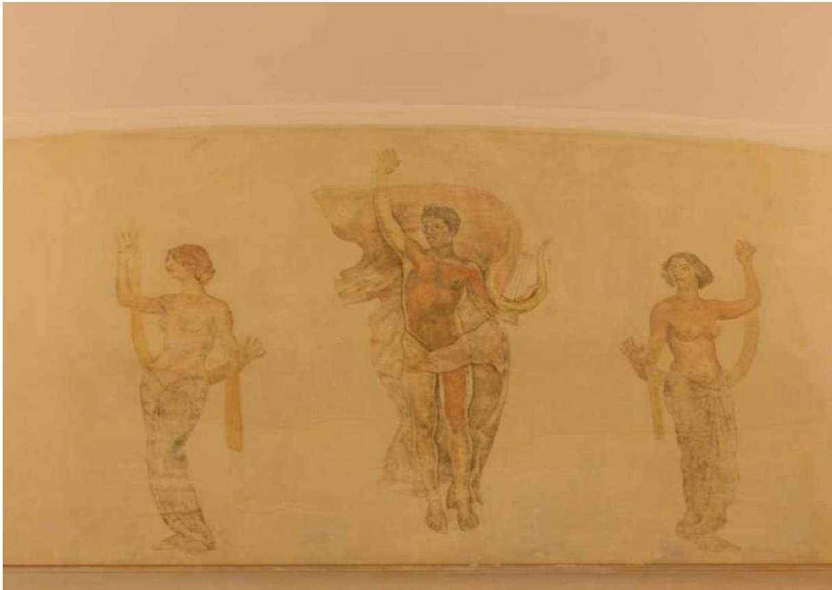
War Anfang der Sechzigerjahre ein Aufreger und wurde sogar vorübergehend überstrichen: Eine Szene mit zwei leicht bekleideten Frauen und einem Mann mit Lyra. Heute ist die Malerei wieder zu sehen und ziert den Bereich über der Bühne im Kleinen Saal.