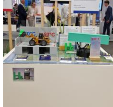
Ttz 3D Modell Seegangsimulator HTE 2025