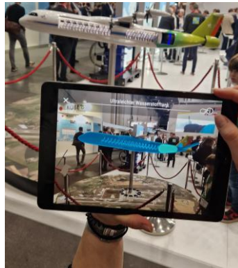
DLR Flugzeug mit Interaktion HTE 2024