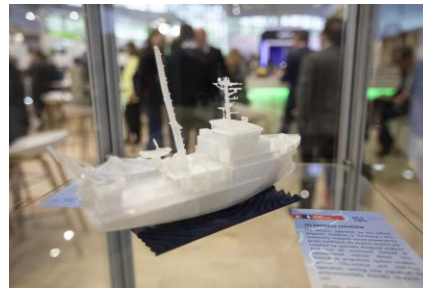
ISL 3D Modell Uthörn HTE 2025