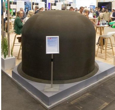
DLR Doppelwandiger LH2 Tank in Originalgröße HTE 2025