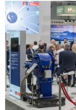
Saacke Brenner HTE 2024