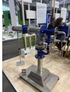
Saacke Brenner HTE 2025