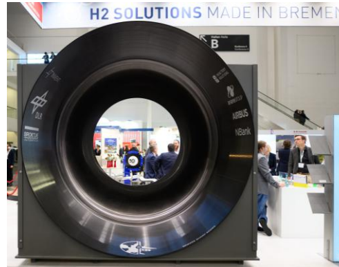
DLR Hystor Tank HTE 2024