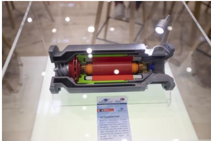
Ariane Group LH2 Transferpumpe HTE 2025