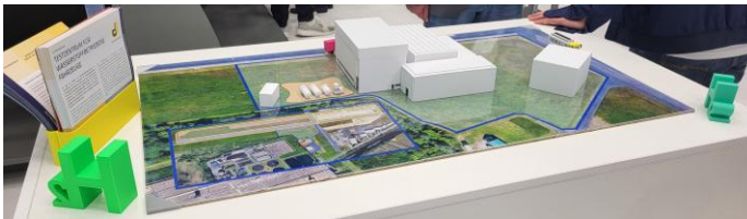
3D Modell Testinfrastruktur HTE 2024

*Vergabe nach Abstimmung mit der Wasserstoffgeschäftsstelle