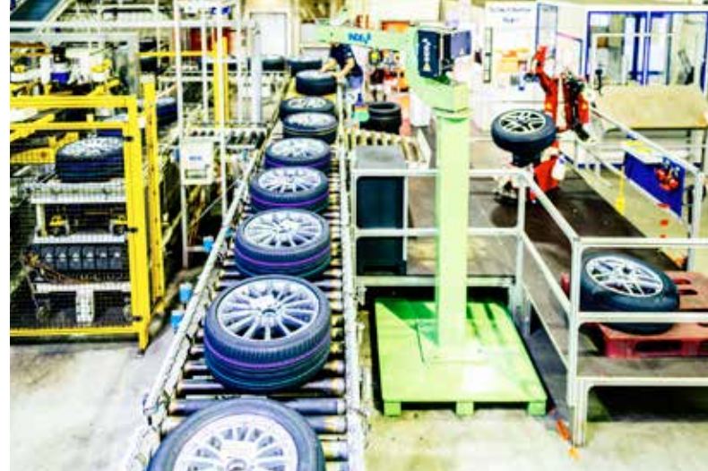
Produktionsbetriebe fertigen In Kundennähe