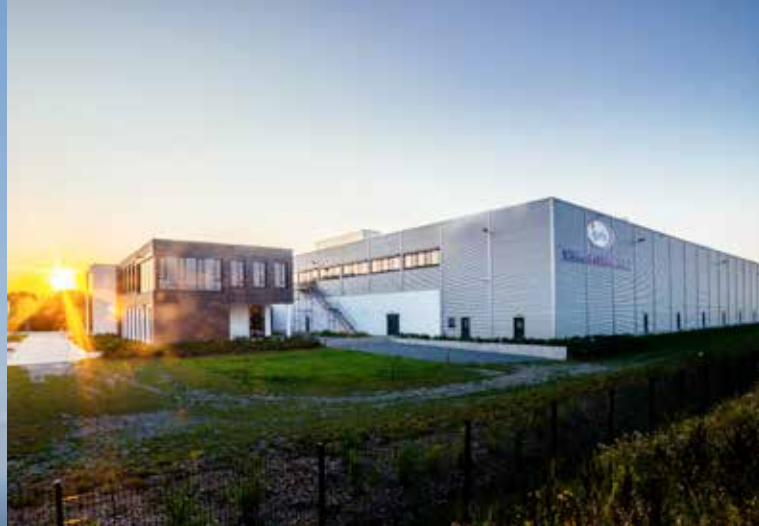
Logistische Schnittstelle im Netzwerk der Oberzentren