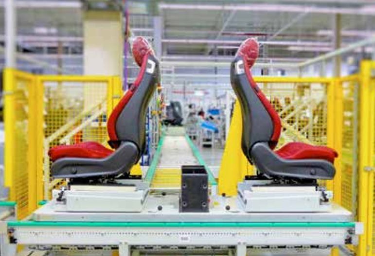
Just-in-sequence Anlieferung zum Mercedes-Benz Werk Bremen