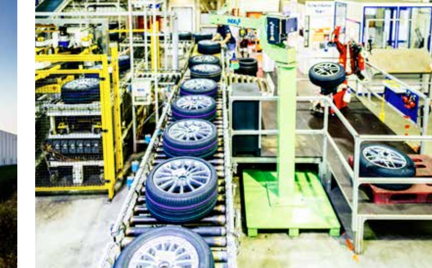
Produktionsbetriebe fertigen In Kundennähe