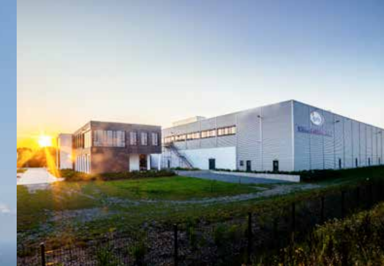
Logistische Schnittstelle im Netzwerk der Oberzentren