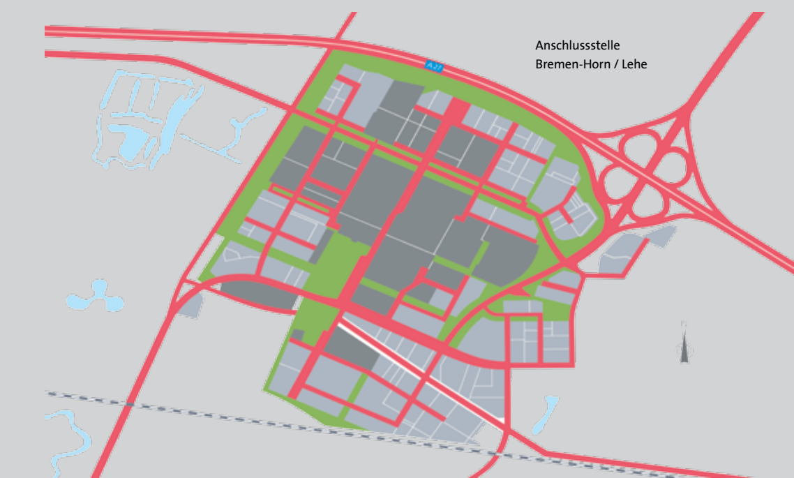
Anschlussstelle Bremen-Horn / Lehe

Umgeben von modernster Architektur werden Kontakte geknüpft und aktive Netzwerke gebildet. Im Technologiepark hat sich eine Innovationskultur gebildet, in der Wirtschaft und Wissenschaft perfekt miteinander wachsen können.