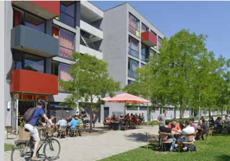
Geliebte Nachbarschaft aus Wirtschaft und Wissenschaft