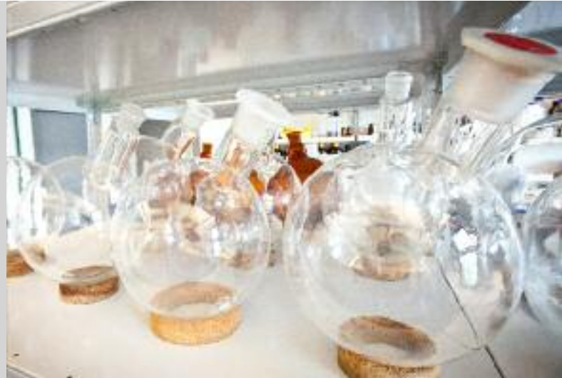
Forschung und Entwicklung