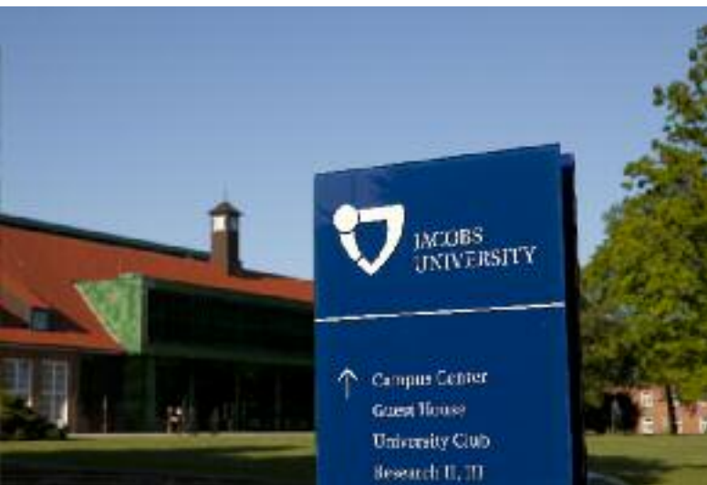
JUB in unmittelbarer Nachbarschaft