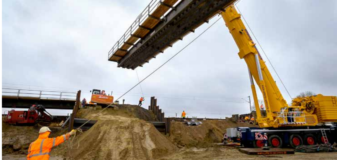
Saturn Petcare GmbH

Neben der Vermarktung der Flächen unter anderem im Gewerbepark Hansalinie und im Bremer Industriepark steht für uns auch die weitere Optimierung der Prozesse des Unternehmensservice Bremen mit seinen Partnern im Vordergrund. National werden wir Bremen wieder auf der Expo Real präsentieren, international werden wir beispielsweise auf der Transport Logistic China in Shanghai sowie auf der ILA in Berlin präsent sein, und es stehen zwei Delegationsreisen in der Luft- und Raumfahrt an. ←