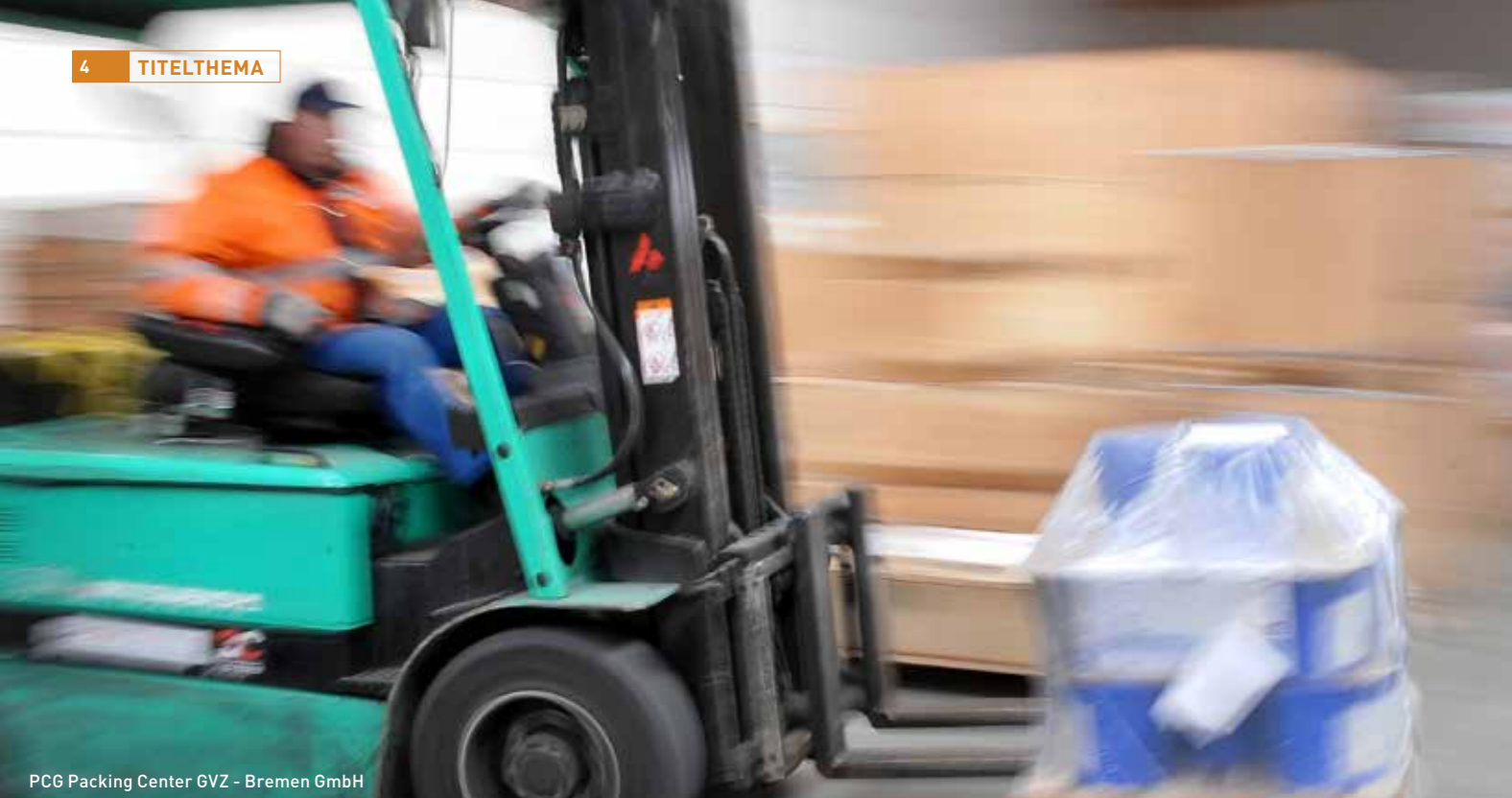
PCG Packing Center GVZ - Bremen GmbH