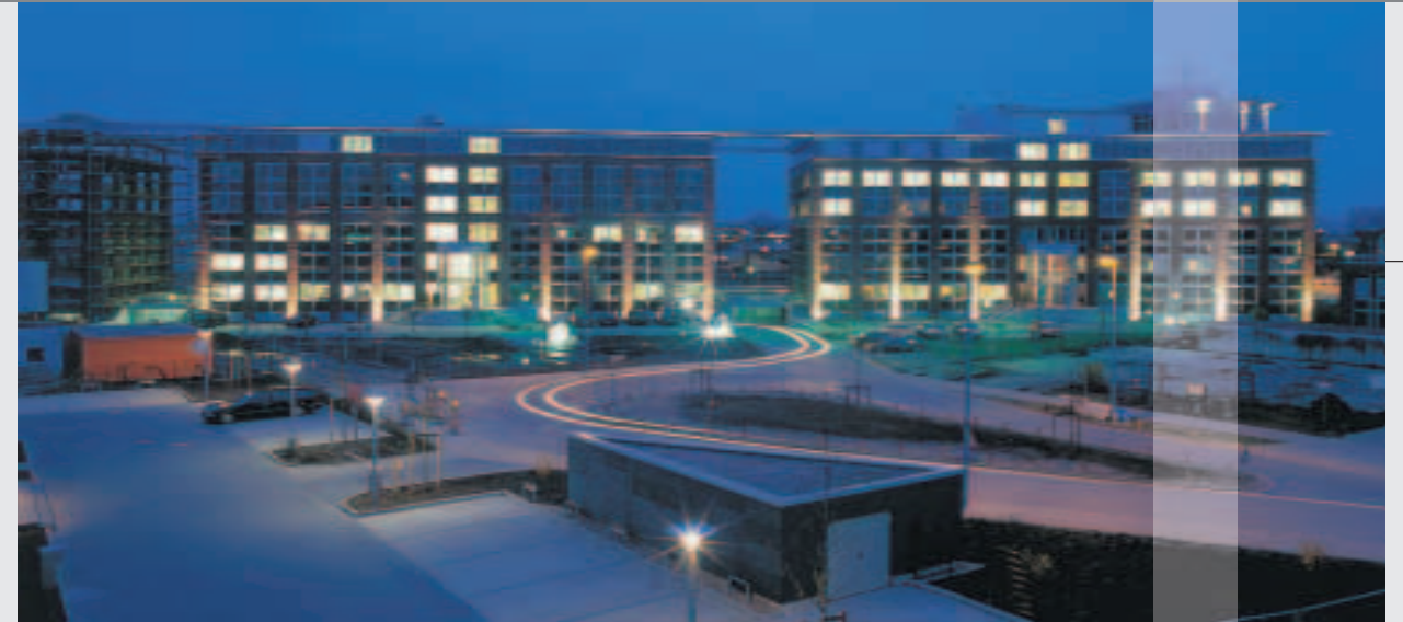
2001 fertig gestellt, das Airport City Center.