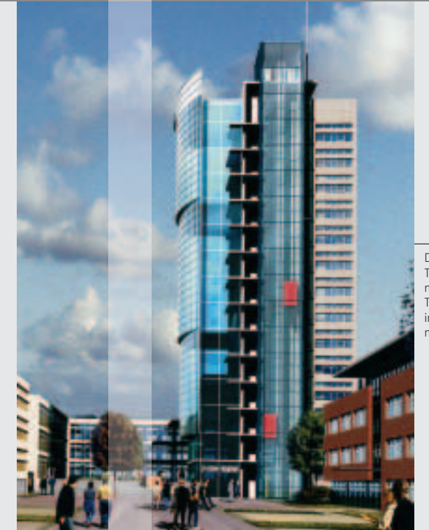
Der Ecom-Tower – ein neues High-Tech-Symbol im Tech-nologiepark.