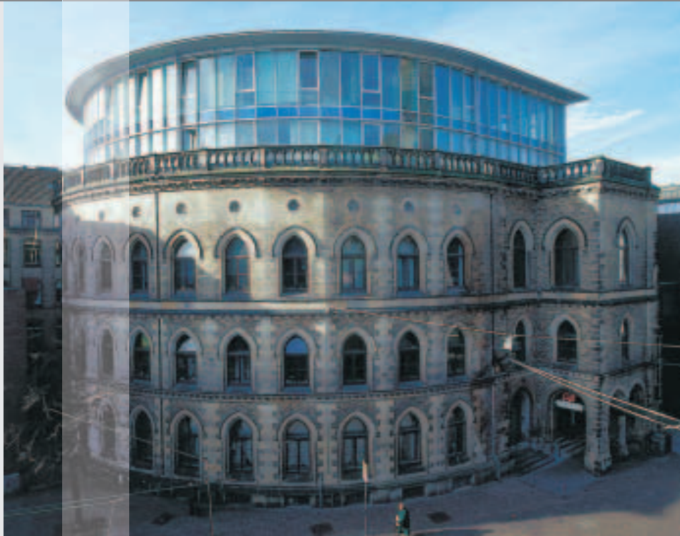
Der Börsenhof A – eines der Altbau-projekte in der Innenstadt und neuer Büro-standort für die Verwaltung der Bremischen Bürgerschaft.