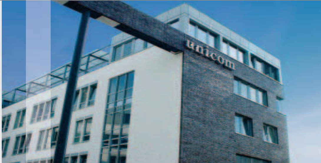
Das unicom im Technologiepark – innovatives Bürogebäude für die New Economy.