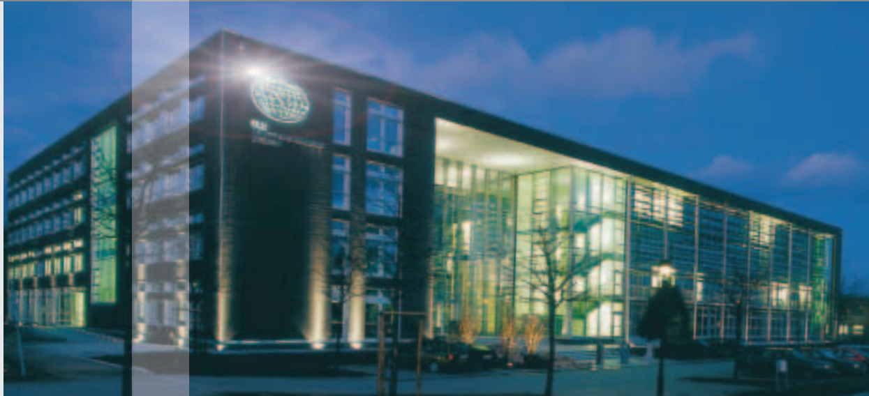
Moderne Architektur verbunden mit einzigartiger Technik - das Gebäude der Technischen Akademie Bremen im Technologiepark.